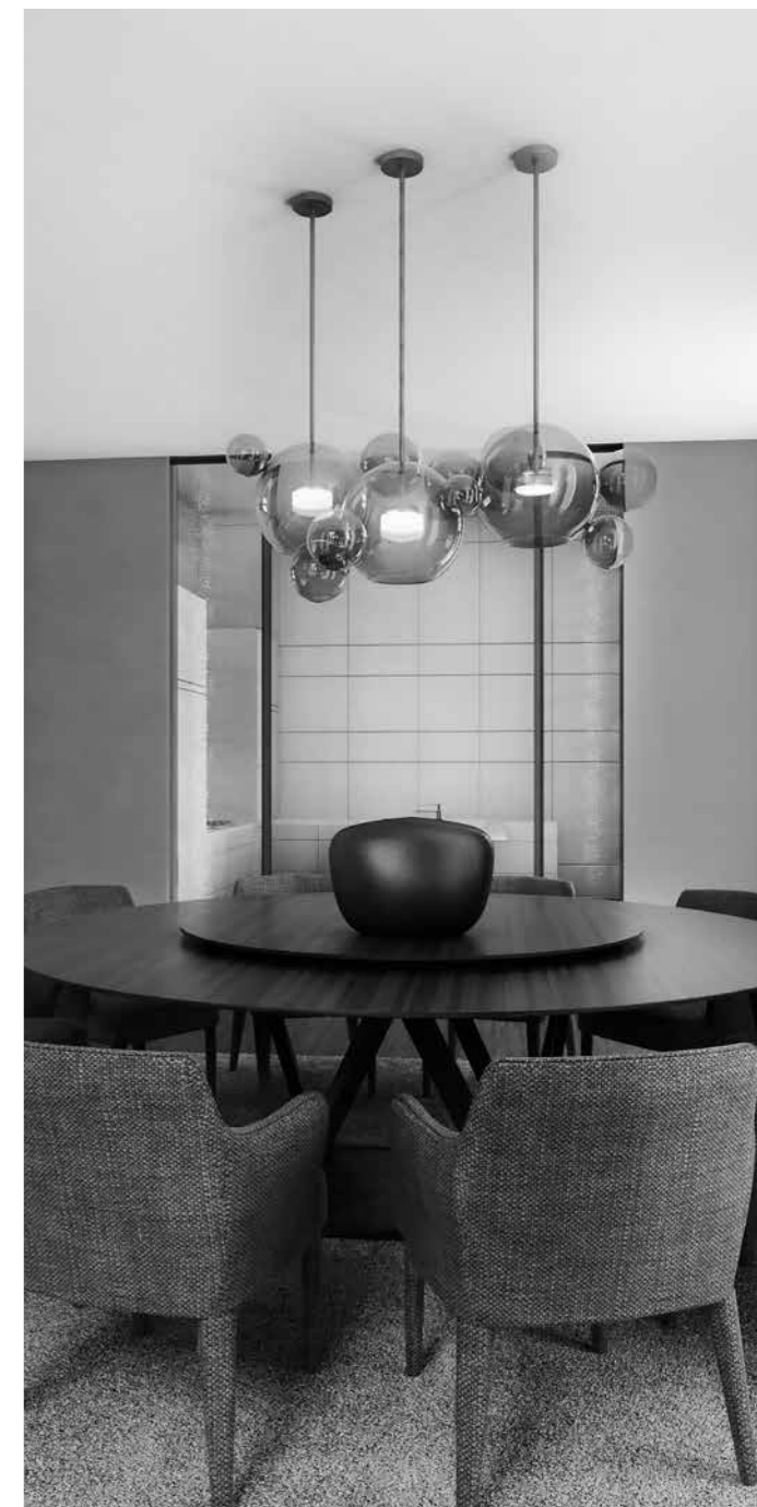
Toton Sánchez Arquitecto de Interiores

Las áreas de almacenamiento en las estancias principales están diseñadas para integrarse en ellas utilizando el mismo concepto que en las áreas sociales, con materiales cálidos y acabados en las mismas tonalidades utilizadas en el resto del apartamento. En las estancias secundarias, las áreas de almacenamiento incluirán puertas de cristal o puertas de madera lacadas en tonos de bronce.